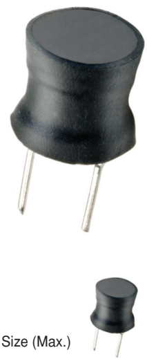
Actual Size (Max.)